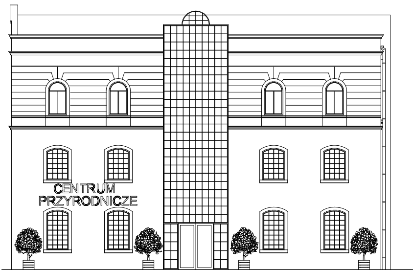
ELEWACJA POŁUDNIOWO-WSCHODNIA 1:200