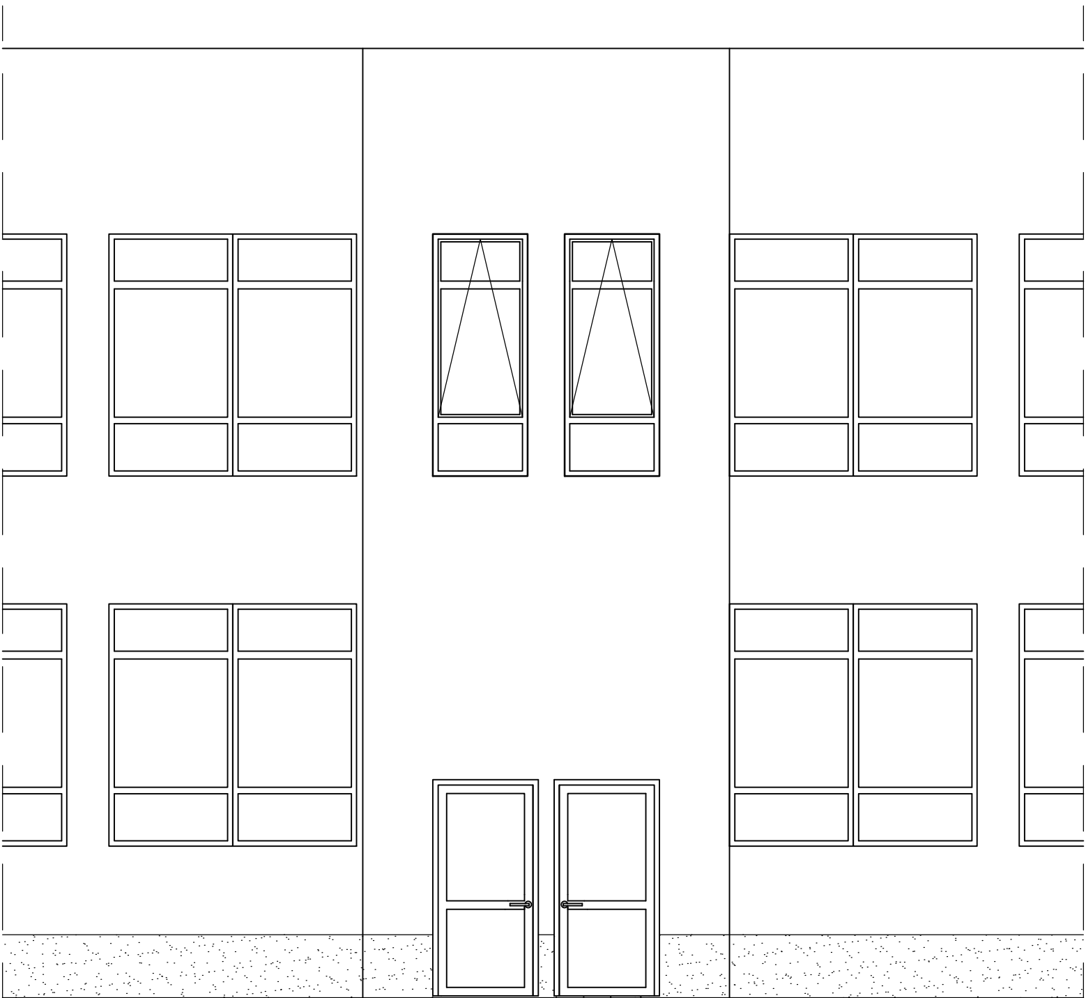
WIDOK ELEWACJI KLATKI SCHODOWEJ skala 1:50